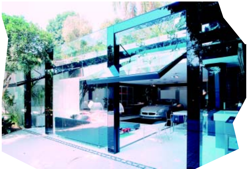
Garagem de vidro: ambiente foi inspirado no pai de Brunete, um apaixonado por carros

A profissional tem estampada em seu currículo uma série de projetos de